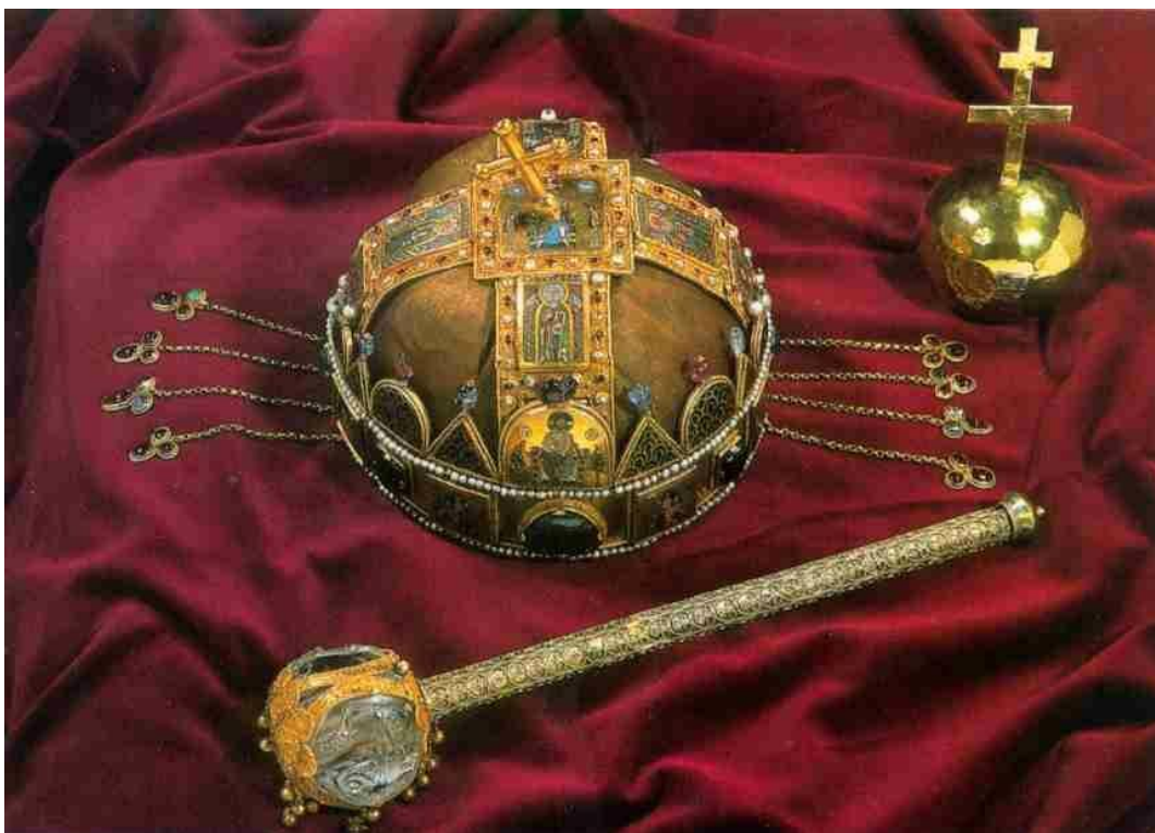
Magyar koronázási ékszerek - Budapest Parlament

A XV. században már jogi formát kapott ez a felfogás. Amikor az ország főurai összeütközésbe kerültek Zsigmond királlyal (1387-1437) és maguk vették át a királyi hatalomnak a birtoklását, ezt a Szent Korona joghatóságának felhatalmazásából teheték meg. Ez alapján a király helyett a koronát